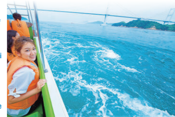
④約50分の絶景船旅が楽しめる Stunning scenery on a 50-min. tour

Take a cruise through the fast-flowing tidal currents of the Kurushima Strait. See the ruins of a Murakami Kaizoku castle on Kurushima and the shipbuilding yard at Imabari. 4520-2 Yoshiumi-cho, Imabari-shi (Yoshiumi Iki-iki-kan Roadside Station) Fee: 2,000 yen Hours: 10:00–16:00 Closed: Wed. from January to mid-March (subject to change due to bad weather or other external factors)