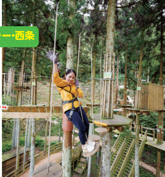
↑スリル満点の冒険が楽しめる Enjoy the adrenaline rush

フォレストアドベンチャー・西条 ☎090-2820-5520 四国最大規模のツリーアスレチックを備える、自然共生型アウトドアパーク。初心者から上級者までさまざまなコースが揃う。④西条市河之内甲486-1本谷公園内 ⑤9～17時 ⑥不定休 This nature park has one of Shikoku's largest forest playgrounds, where you can try any course from beginners to advanced. Hondani Park, 486-1 Kawanouchi Ko, Saijo-shi Hours: 9:00-17:00 Closed irregularly