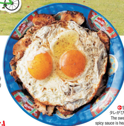
①甘辛のタレがぴったり The sweet and spicy sauce is heavenly!