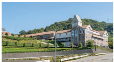
↑まるで西洋のお城のよう Looks like a European castle

タオル美術館 ☎0898-56-1515 タオルがテーマの美術館。作品や製造工程が見学できるほか、レストランなども併設。④今治市朝倉上甲2930 ⑤無料(ギャラリーは見学1000円) ⑥9時30分～18時 ⑦無休(冬期不定休あり) A museum where you can see towel art and learn about how towels are made. Visit the gift shop, restaurant, and cafe. 2930 Asakura-kami Ko, Imabari-shi Free admission (1,000 yen to tour the gallery.) Hours: 9:30-18:00 Open every day (may be closed on some days in winter)