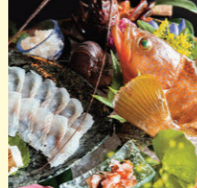
鮮度抜群の瀬戸内の幸を満喫 Enjoy the freshest delicacies of the Seto Inland Sea

瀬戸内海を望むゆったりとした時間を楽しめる料理自慢の宿。来島海峡の海水をくみ上げ沸かした100%海の露天風呂でサイクリングの疲れも癒やせる。①今治市吉海町名駒25 ②1泊2食付2万円～ IN/OUT 15時～/10時 This hotel has great homemade seafood dishes and affords beautiful views of the Seto Inland Sea. The open-air 100% seawater bath is great for relaxing after a day of cycling. 25 Nagoma, Yoshiumi-cho, Imabari-shi Rates: From 20,000 yen/night (incl. dinner and breakfast) Check-in 15:00 / check-out 10:00