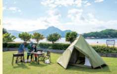
好きな場所でキャンプができるフリーサイト Choose your camping spot

釣りや水遊び、シーカヤックなどアウトドアを楽しめるキャンプ場。テントやランタンのレンタル、バーベキュー食材の販売もあり、気軽にキャンプを楽しめる。①上島町生名2798 ②利用料1日380円～(サイト利用料別途)IN/OUT 8時30分/17時 Enjoy fishing, swimming, and sea kayaking. You can camp here with no preparation beforehand—rent tents and lanterns, and purchase food to barbecue right here. 2798 Ikina, Kamijima-cho Entry fee: From 380 yen/day (excluding site usage fees) Check-in 8:30 / check-out 17:00