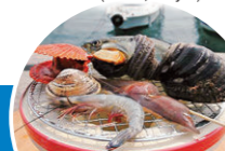
⑤潮流を楽しんだ後は海鮮バーベキュー2500円～ Back on shore, try the seafood barbecue (from 2,500 yen)