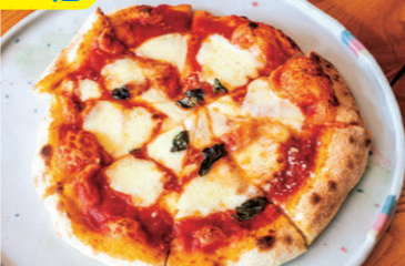
本格的な石窯ピザが味わえる Savor authentic stone-oven-baked pizza

自作の石窯で焼くピザ1000円～は、表面はパリッと香ばしく、中はもちもち。食材にもこだわり、イタリア産の小麦とチーズを使用。①上島町弓削太田114 ②11～14時 ③月～金曜 ☎080-4635-8334