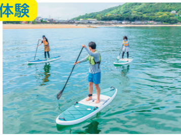
海上から絶景を満喫 Take in the view from the water

環境省の「快水浴場百選」に選ばれた松原海水浴場や隣の日比海岸でSUPを体験できる。①上島町弓削 ②6600円～(2名～) ③時休4～10月の土・日曜、祝日に開催。公式WEBサイトで要事前予約 ☎0897-72-9277